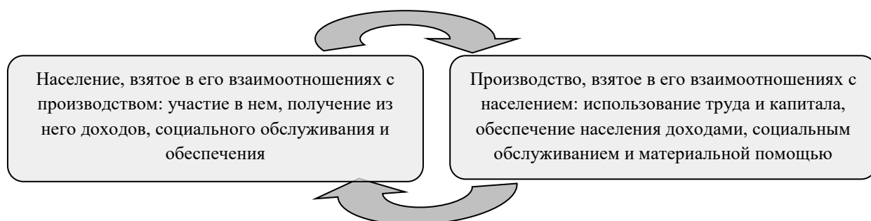
Рис.1. Социальная сфера в разрезе взаимоотношений «население-производство»

Взаимоотношения населения с производством (рис.1) – т.е. участие населения в производстве и получение доходов, связанных с использованием труда и капитала, обеспечение населения материальной помощью и социальным обслуживанием и т.д., – учитываются при расширенном понимании социальной сферы, необходимом для моделирования ее финансирования. При этом активное (занятое в общественном производстве) население выступает как собственник трудовых ресурсов и капитала, и возникают опосредованные бюджетом взаимоотношения населения с производством. Это позволяет, не ограничиваясь вопросами непосредственного бюджетного финансирования потребления населения, учитывать доходы населения, активные (получаемые в виде зарплаты трудящимися или в виде так называемых предпринимательских доходов – прочими занятыми, названными условно «предпринимателями») и пассивные (денежные социальные трансферты, или социальные выплаты).