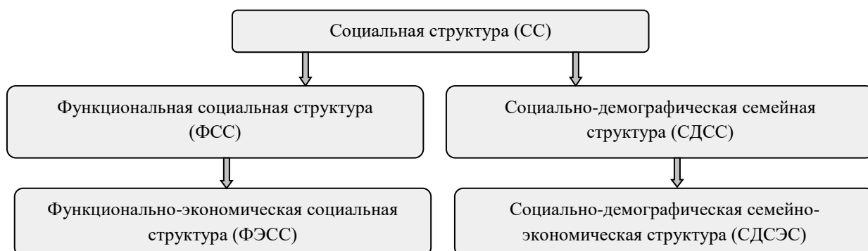
Рис.2. Социальная (социально-экономическая) структура населения

Это порождает названную функциональной социальной структурой (ФСС) многоуровневую иерархическую структуру исполнителей (или исполнений) соответствующих функций (см. рис.2). Она содержит две ступени – собственно функциональную (ФСС) и функционально-экономическую (ФЭСС). Первая ступень (макроуровень) состоит из трех функциональных слоев населения , определяемых видом основных доходов двух активных слоев (трудящихся и предпринимателей) и слоя незанятых («трансфертников»). Далее включается детализация макроуровня – до нижнего уровня непересекающихся социальных групп населения , согласно перечню конкретных социальных ролей, исполняемых индивидами с соответствующим социальным статусом. Он определяется отношением индивида к общественному производству (его занятостью или незанятостью, видом занятости и т.д.), общественно признанными правами на получение социальной помощи (по виду социальных выплат) и степенью прозрачности получаемых доходов (официальные или теневые).